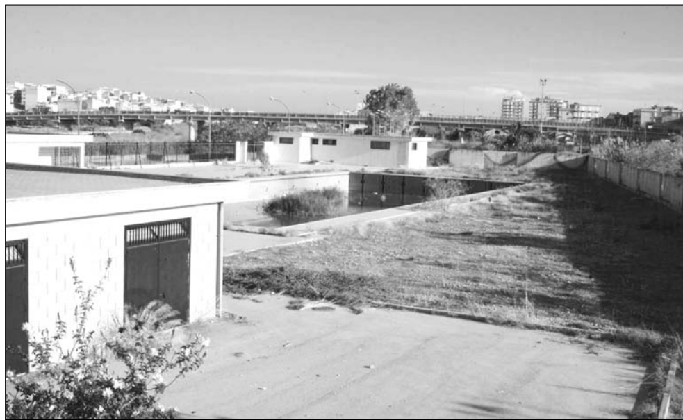
Nella foto di Salvatore Sanfilippo, la piscina comunale da anni abbandonata, un esempio di come viene sperperato il danaro pubblico. La vasca olimpionica è diventata oramai una palude: ricettacolo di zanzare, ratti, biscie. Un luogo di cui dovrebbe occuparsi l'ufficiale sanitario

Altro esempio di sperpero di denaro pubblico