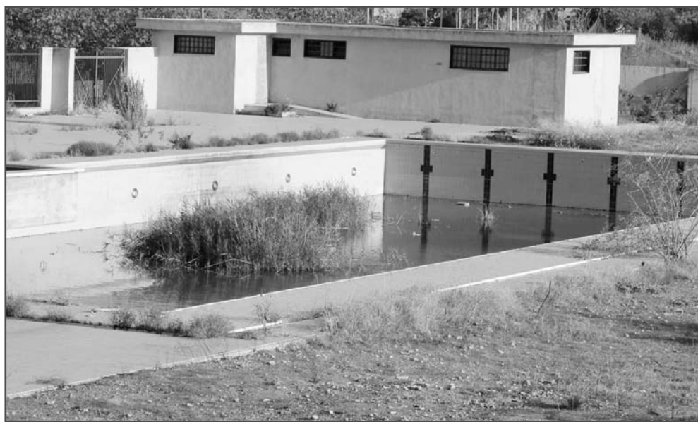
La piscina comunale