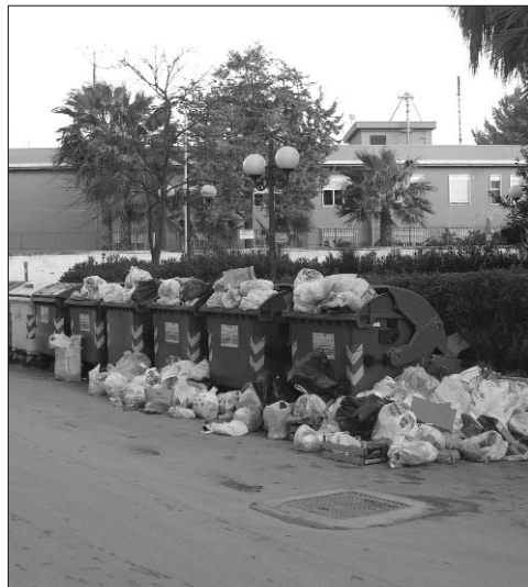
Ecco come si presentano i cassonetti

La Cgil, ha fatto i conti: "Nelle Ato sono arrivati a sedere 189 consiglieri d'amministrazione, col costo annuo di 12 milioni di euro". Sono state attivate consulenze fino a 150 mila euro e alcuni rappresentanti sono stati dotati di auto blu. I servizi di raccolta e trasporto vengono appaltati a imprese private". Legambiente si è interessata di alcune società legate alle Ato e finite sotto inchiesta per presunte assunzioni clientelari, illogica conseguenza di questo carrozzone politico. Come tante storie siciliane, esiste un problema di natura finanziaria, che ha appesantito i bilanci: introiti limitati dal fatto che il prodotto differenziato non si riesce a vendere, dopo il